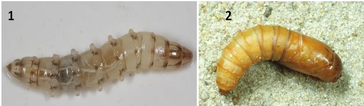
Figure 2. Stades pré-imaginaux de Tabanidae. 1. Larve (Web.1); 2. Nympe (Web. 2)

Pour les stades pré-imaginaux (Fig. 2), selon le type d'habitat, on a utilisé l'appareil de Berlese qui prélève le benthos vivant dans le sol, dans les milieux subhumides, la litière du sol, l'humus, les tourbières et les bords des rivières. Dans les milieux aquatiques à eau lotique, tels les cours d'eau, les rivières et les ruisselets, on a utilisé le filet Surber qui permet de faire un échantillonnage quantitatif du benthos vivant dans le substrat. Le Filet à Dérive a été également utilisé pour récolter les macro-invertébrés benthiques dans les eaux en dérive. Concernant les eaux lénitiques, le prélèvement s'est basé sur le filet Troubleau pour prélever la faune en pleine eau.