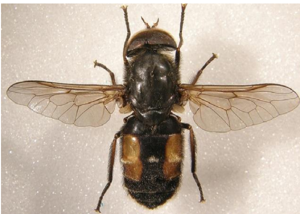
Figure 3. Adulte de Hybomitra bimaculata (Web. 3)

Pour les stades imaginaux (Fig. 3), le filet entomologique a été utilisé pour chasser les imagos en vol en bordure des cours d'eau, au niveau de la ripisylve et des formations végétales herbacées et arbustives environnantes.