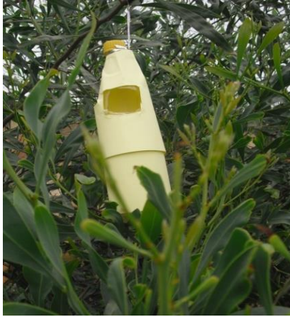
Figure 4. Piège attractif