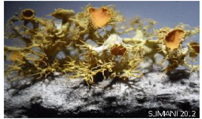
Figure 2. Teloschistes chrysophthalmus (Slimani, 2012)

This study reveals 27 species on various substrates (soil and barks), with different growth forms (Crustose, foliose, fruticose, Composite and Leprose). Among the fruticose ones, we have Teloschistes chrysophthalmus , a subcosmopolitan species (Werner 1949), indicator of wetlands (lacustrine ecosystems). It grows on bark of Fraxinus oxyphylla at different stages of development. It is a bushy lichen gray color or light yellow to orange, with many marginal lobes ; very frequent orange apothecia , measuring 2 to 7 mm, lined with light cilia. We have also found it at Tonga Lake (El Kala National Park) on the bark of Olea europaea .