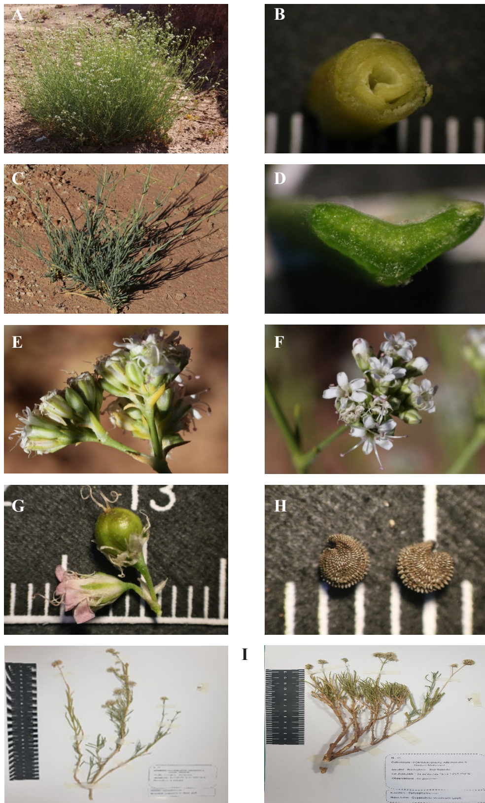
Figure 1. Gypsophila struthium subsp. struthium , A : plante en floraison ; B : coupe transversale de la tige ; C : tiges feuillées ; D : coupe transversale de la feuille ; E : vue latérale de l'inflorescence ; F : fleurs ; G : capsule et fleur ; H : graines réniformes ; I : spécimens d'herbier de Gypsophila struthium subsp. struthium .

Figure 1. Gypsophila struthium subsp. struthium , A: flowering plant; B: cross section of the stem; C: plant showing linear leaves; D: cross-section of the fleshy leaf; E: lateral view of inflorescence; F: flowers; G: capsule and flower; H: subreniform seeds; I: herbarium specimens of Gypsophila struthium subsp. struthium .